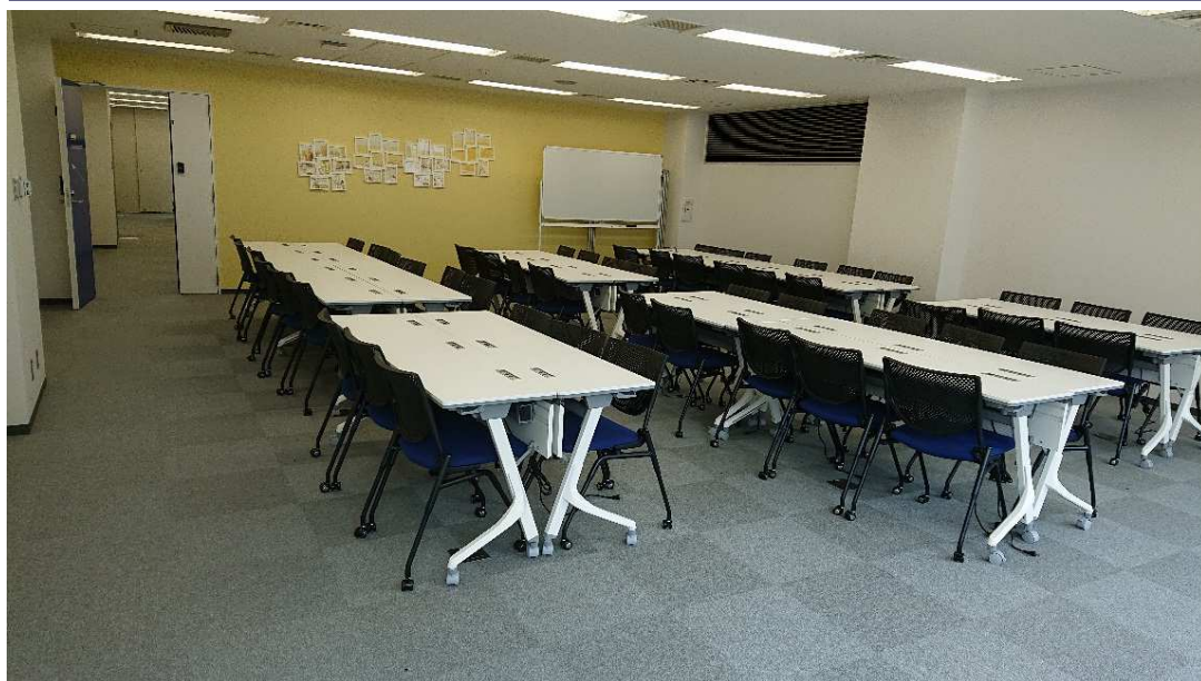
サンフランシスコ